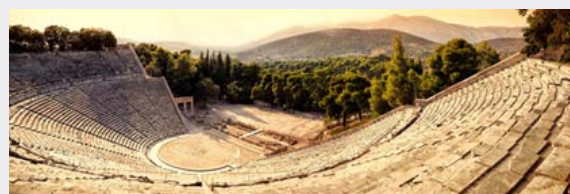
Grèce - Péloponnèse - Théâtre d'Epidaure

* : Sites inscrits au patrimoine mondial de l' Unesco