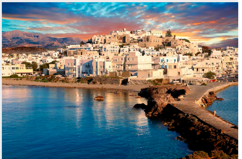
Port de Naxos

Le port de Naxos est une ville assez étendue et animée. Elle est dominée par la porte du temple d' Apollon que l'on aperçoit de loin en abordant l'île. Un impressionnant dédale de ruelles pavées et de passages voûtés permet de monter jusqu'au Kastro Venitien, dominant la ville. Une balade dans ces rues provoque inévitablement un bond dans l'histoire.