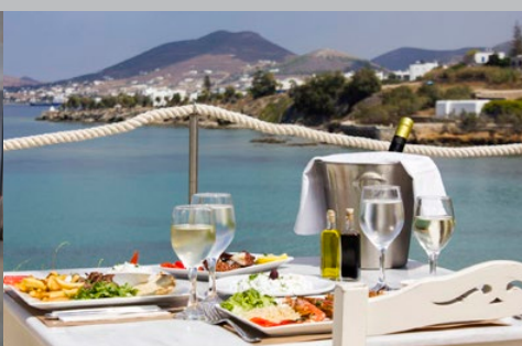
Hôtel Paros Bay