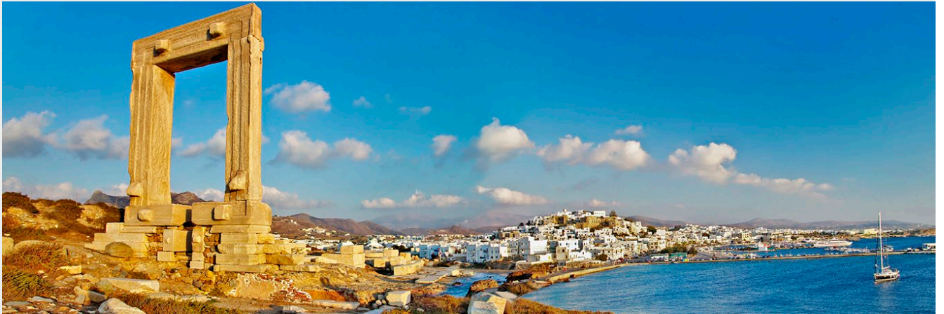
Naxos et la porte du temple d'Apollon