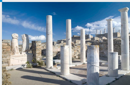
Site archéologique de Délos