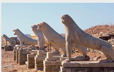
La Terrasse des Lions - Délos

Site archéologique majeur de la Grèce , la visite de Délos est incontournable. Elle est aujourd'hui inhabitée et se visite en excursion depuis Mykonos , l'île la plus proche, mais également depuis Naxos , Paros . Le site est inscrit au patrimoine mondial de l' Unesco . Un musée regroupe une partie des vestiges découverts sur l'île.