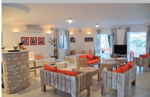
Hôtel Paros Bay