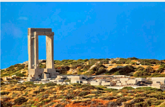
Porte du temple d'Apollon