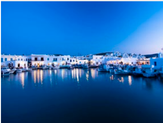
Petit port Vénitien de Naoussa - Paros