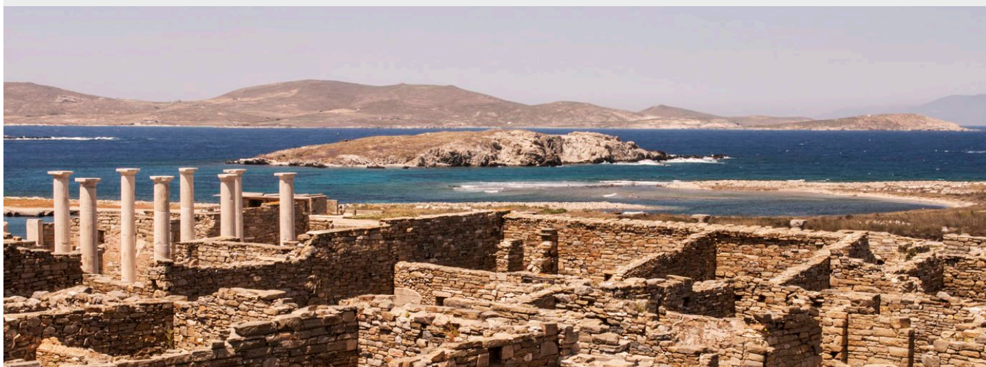
Site archéologique de Délos