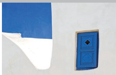
Paros et son architecture Cycladique

Pension complète (boissons incluses à l'hôtel), visites, guide et transferts exclusifs. Visite d' Athènes et de l' Acropole (option). Vols non compris