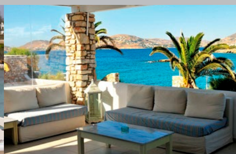
Hôtel Paros Bay

Le Paros Bay est un magnifique petit hôtel de charme, construit dans le pur style Cycladique , décoré avec goût et offrant tout le confort ainsi que les services dont vous avez besoin pour passer des vacances de rêve. Prenez le temps de vous détendre au bord de la piscine offrant une vue imprenable sur la baie de Parikia .