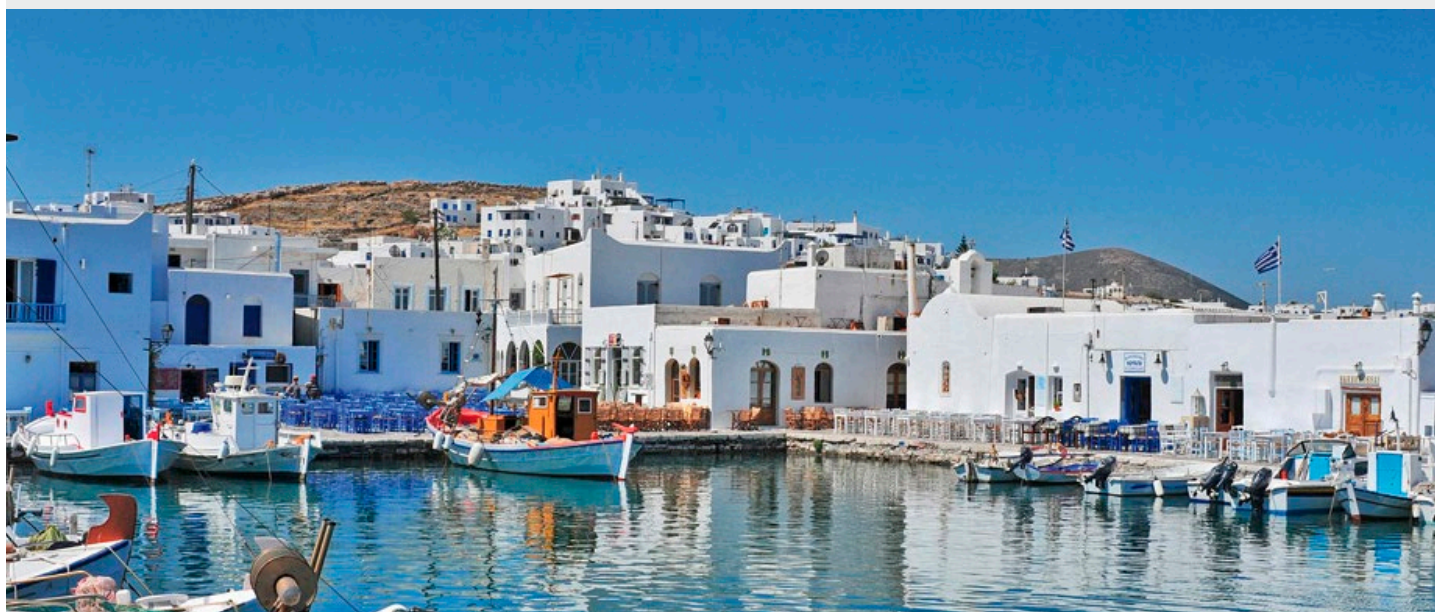
Petit port Vénitien de Naoussa - Paros

Programme type pour groupes constitués. L'ordre des visites pourra être modifié, selon contraintes météorologiques ou autres événements. Le 1 ère et/ou la dernière nuit peuvent être prévue à Athènes selon les horaires des vols.