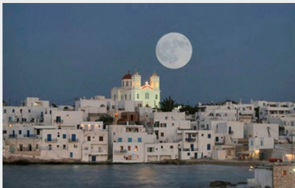
Eglise Panagia Ekatontapiliani au centre de Parikia