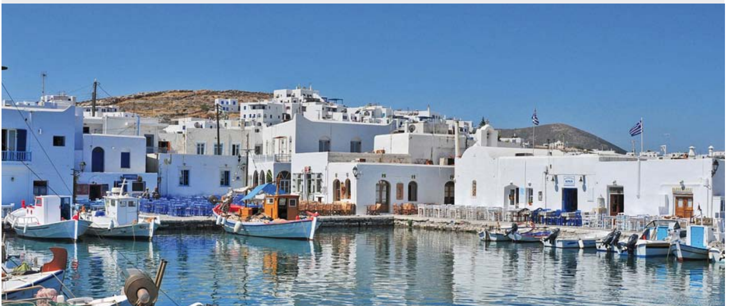
Petit port Vénitien de Naoussa - Paros

Programme type pour groupes constitués. L'ordre des visites pourra être modifié, selon contraintes météorologiques ou autres événements. Le 1 ère et/ou la dernière nuit peuvent être prévue à Athènes selon les horaires des vols.