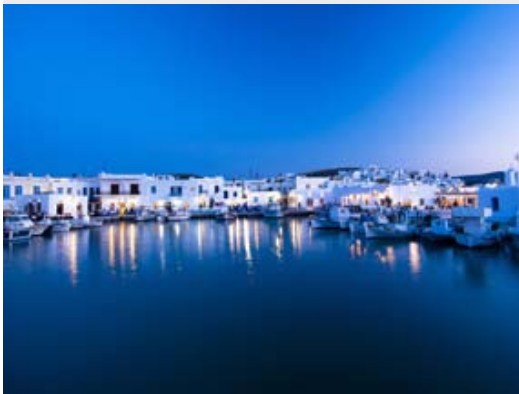
Petit port Vénitien de Naoussa - Paros