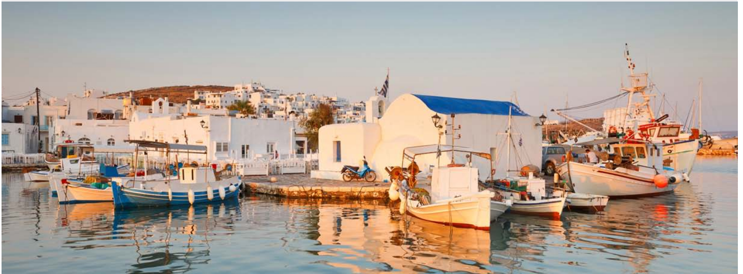
Petit port Vénitien de Naoussa - Paros