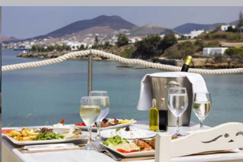
Hôtel Paros Bay