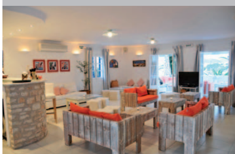
Hôtel Paros Bay