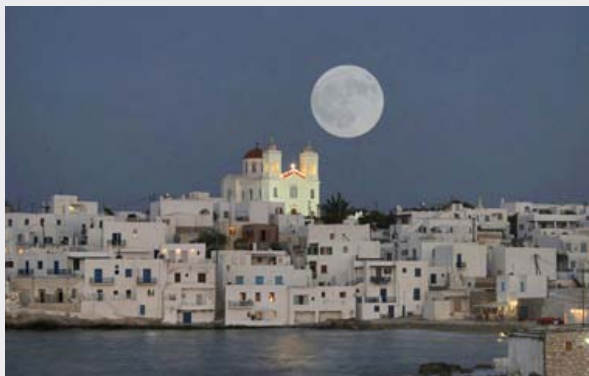
Eglise Panagia Ekatontapiliani au centre de Parikia