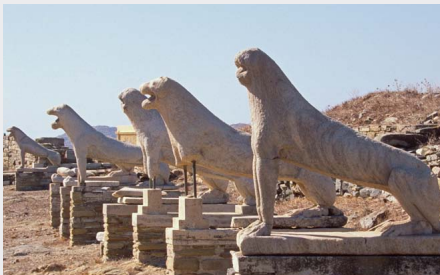
La Terrasse des Lions - Délos

Site archéologique majeur de la Grèce , la visite de Délos est incontournable. Elle est aujourd'hui inhabitée et se visite en excursion depuis Mykonos , l'île la plus proche, mais également depuis Naxos , Paros . Le site est inscrit au patrimoine mondial de l' Unesco . Un musée regroupe une partie des vestiges découverts sur l'île.