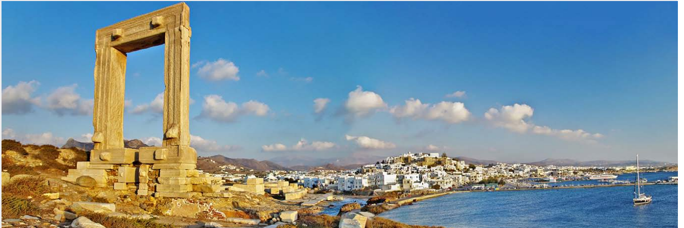
Naxos et la porte du temple d'Apollon