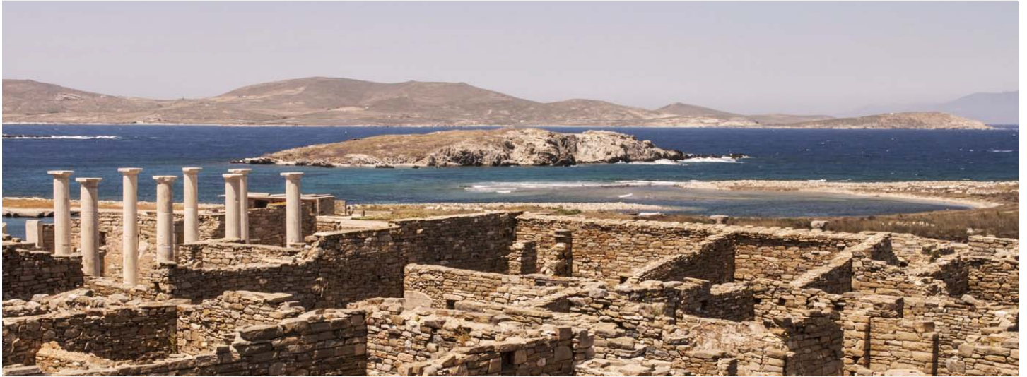
Site archéologique de Délos