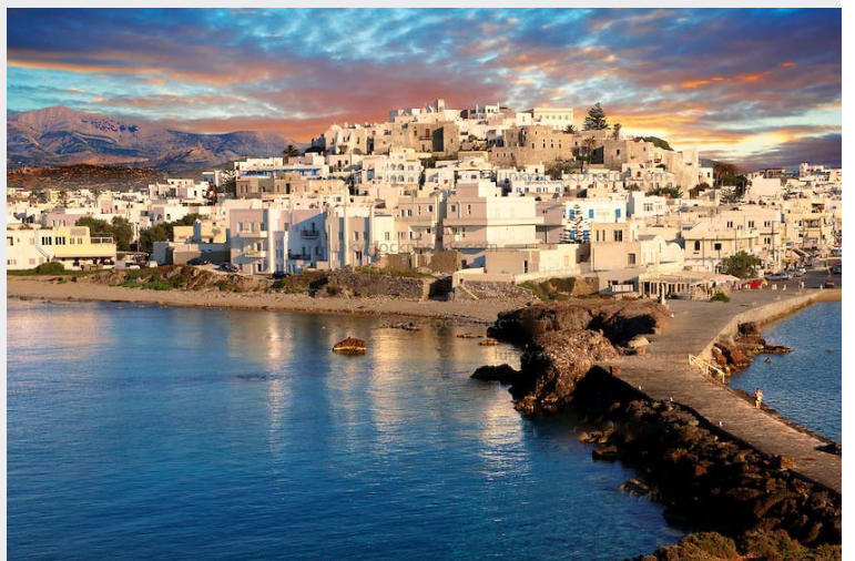
Port de Naxos

Le port de Naxos est une ville assez étendue et animée. Elle est dominée par la porte du temple d' Apollon que l'on aperçoit de loin en abordant l'île. Un impressionnant dédale de ruelles pavées et de passages voûtés permet de monter jusqu'au Kastro Venitien, dominant la ville. Une balade dans ces rues provoque inévitablement un bond dans l'histoire.