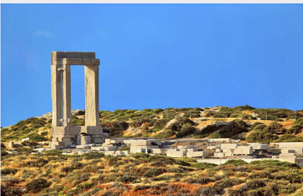
Porte du temple d'Apollon