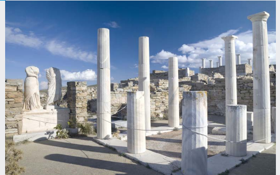
Site archéologique de Délos