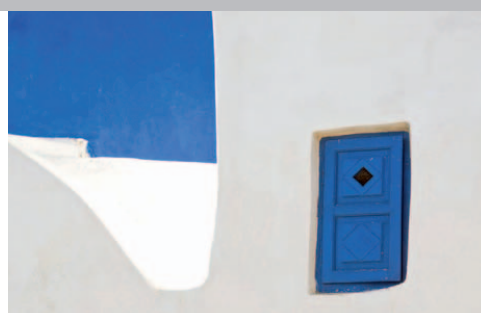
Paros et son architecture Cycladique

Pension complète (boissons incluses à l'hôtel), visites, guide et transferts exclusifs. Visite d' Athènes et de l' Acropole (option). Vols non compris