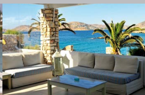
Hôtel Paros Bay

Le Paros Bay est un magnifique petit hôtel de charme, construit dans le pur style Cycladique , décoré avec goût et offrant tout le confort ainsi que les services dont vous avez besoin pour passer des vacances de rêve. Prenez le temps de vous détendre au bord de la piscine offrant une vue imprenable sur la baie de Parikia .