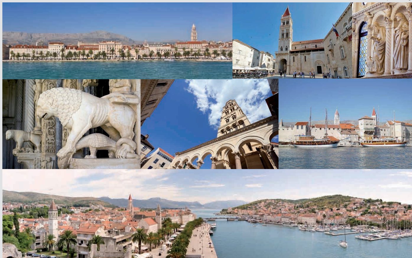
Split - Trogir

L'excursion comprend : guide, transferts, déjeuner, billets d'entrée, visite de la cave à vin et dégustation.