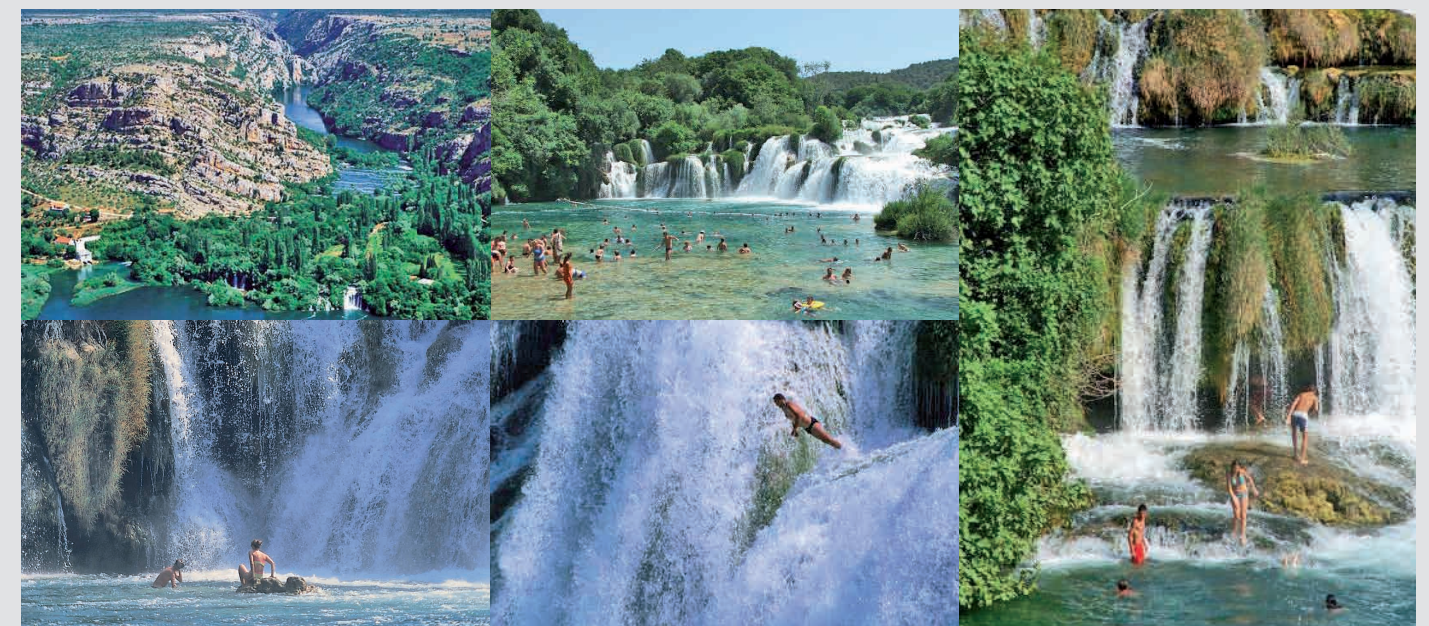
Chutes de Krka

L'excursion comprend : guide, transferts, déjeuner, billets d'entrée.